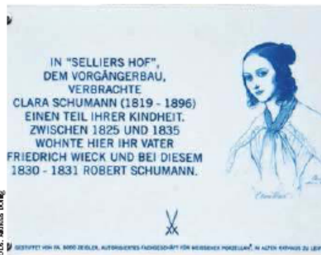
Eine Meissener-Porzellan-Plakette am Grandhotel am Neumarkt/Ecke Grimmische Straße erinnert an die Pianistin.

begleiteten Auftritte seiner Tochter bewiesen. Wieck sah sich als Claras Impresario, organisierte die oft mit Strapazen verbundenen Konzertreisen.